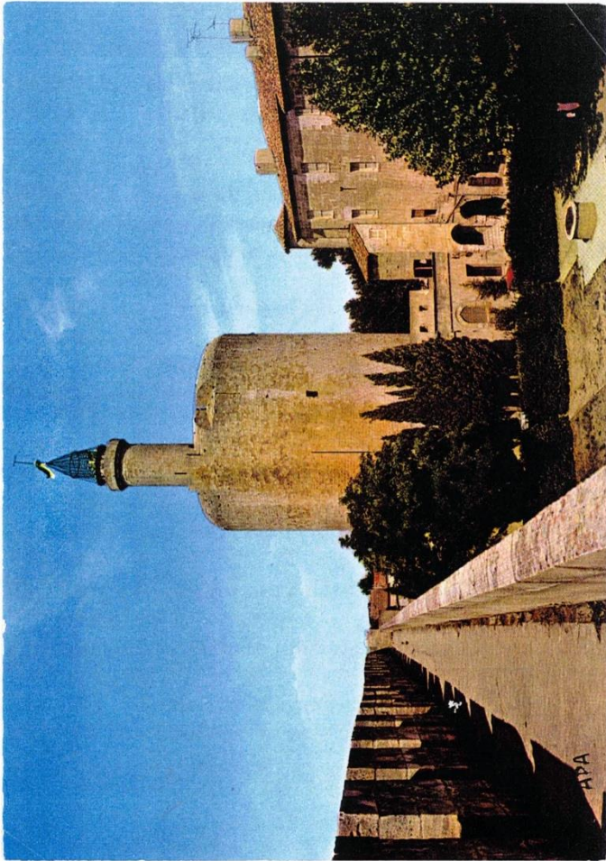
La tour de Constance à Aigues-Mortes