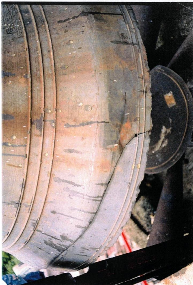
Cloche fêlée du Beffroi de l'Hotel de Ville