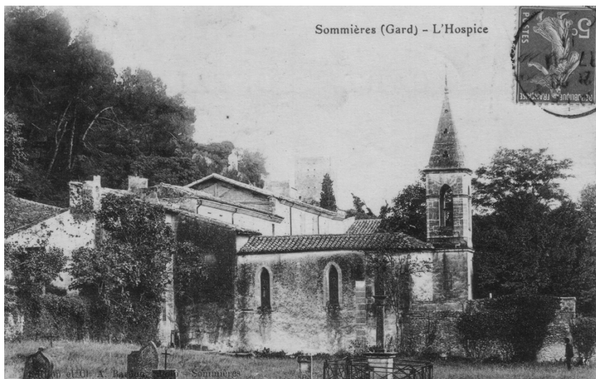
Couvent des Cordeliers