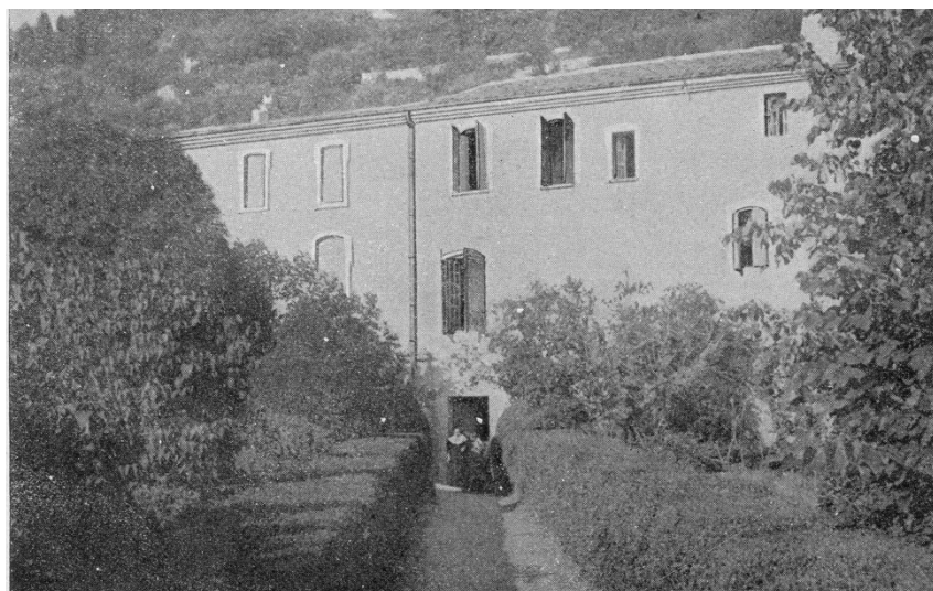
Couvent des Cordeliers