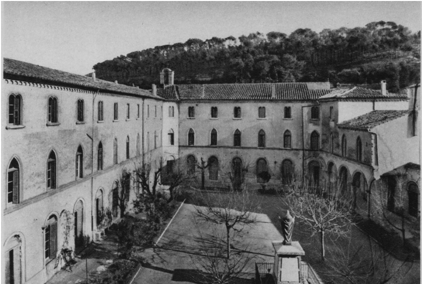
Vue de la cour intérieure.

Ces conditions sont acceptées et un bail est rédigé le 11 février 1777, au prix de cinquante livres par an, pour neuf années.