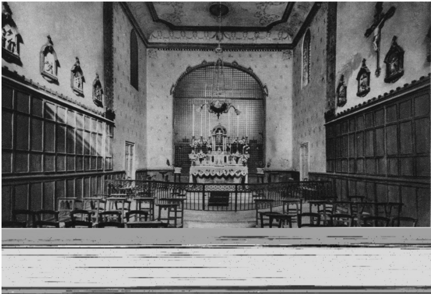
Chapelle du couvent 36

Un arrêté du préfet du Gard, du 10 septembre 1810 « autorise les dames de Saint Ursule à se réunir pour exercer dans la ville de Sommières les fonctions d'institutrices conformément à leurs statuts » 35