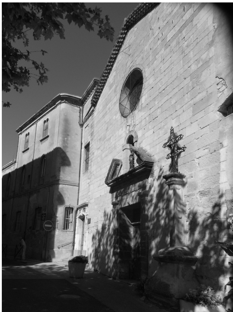
Façade de la chapelle. Rue du Bourguet