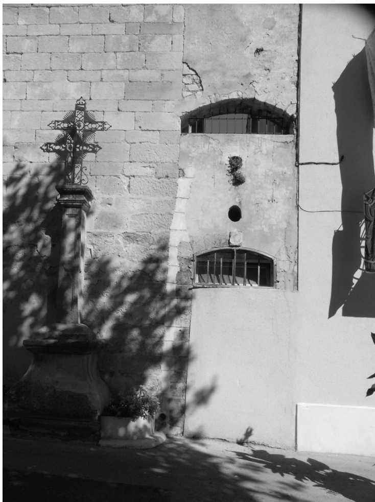
Emplacement de l'entrée de l'ancienne fabrique Place du Bourguet