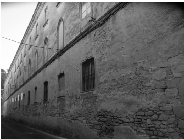
Couvent des Récollets. Façade rue Gabriel Péri