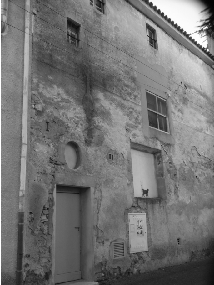
Façade de l'ancienne fabrique de molletons Rue du colonel Vialla

propose d'aménager dans les pièces inoccupées de l'ancien couvent. Il offre même d'avancer 12 000 livres dont le remboursement, sans intérêt, pourra s'effectuer en six ans et ce, après le commencement du travail.