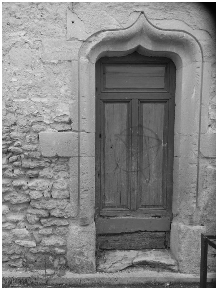
Porte du ministère. Rue Gabriel Péri

doivent quitter le couvent qui est placé sous séquestre et décrété bien national.