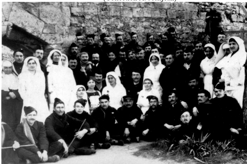
Un groupe de soldats avec leurs infirmières (photo prise sur la plate-forme au pied de la tour)