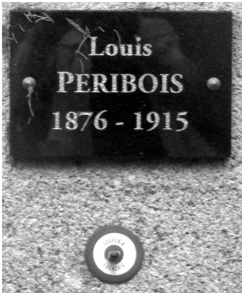
Plaque sur la tombe de Louis Péribois au cimetière de Sommières