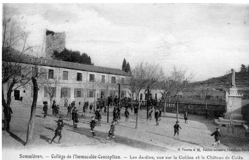
Sommières. — Collège de l'Immaculée-Conception. — Les Jardins, vue sur la Colline et le Château de Calès