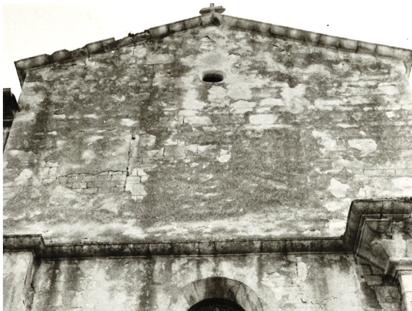
Façade de la chapelle en 1977 On devine la trace des deux fenêtres obturées d'après le devis Saussine A.C. Sommières

Parmi les travaux prévus figure la condamnation de deux fenêtres dans le local situé au-dessus de la chapelle. On voit la trace de leur emplacement muré sur une photo prise en 1977. Elles ont été rouvertes depuis !