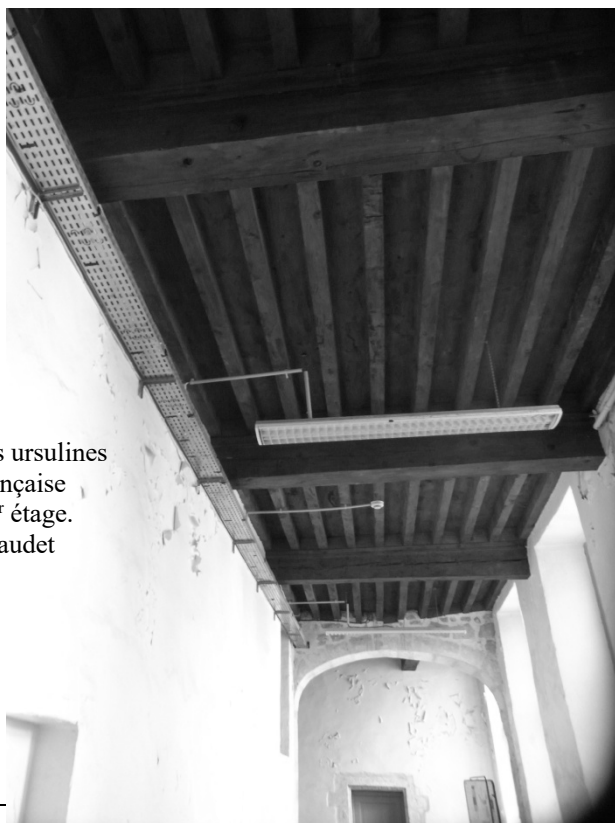
Ancien couvent des ursulines Plafond à la française du couloir du 1 er étage.

Le premier étage a conservé les plafonds à la française dans les couloirs et la salle servant de bibliothèque. Le second étage a été complètement remanié à plusieurs reprises et on ne retrouve rien de ce qu'il était à l'origine.