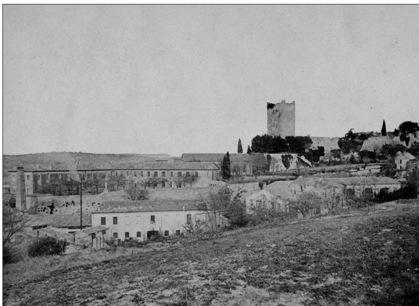
Le couvent des Ursulines vers 1910

l'enceinte des remparts. Peu de Sommiérois à qui vous demanderiez l'adresse de l'ancien couvent des Ursulines seraient capables de vous indiquer où il se situe. En effet, après le départ des Ursulines à la Révolution, il abrita pendant plus d'un siècle le collège de l'Immaculée Conception. Il a été baptisé depuis "Espace Lawrence Durrell".