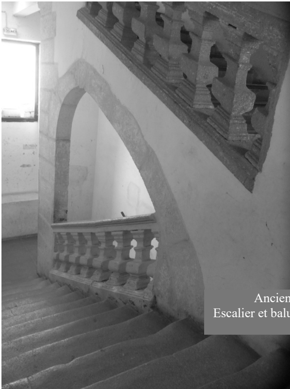
Ancien couvent des Ursulines Escalier et balustres du XVII ème siècle

Les cellules des religieuses et les dortoirs des jeunes filles devaient se situer au 2 ème étage. Le premier était occupé par les salles de classe et d'activités diverses.