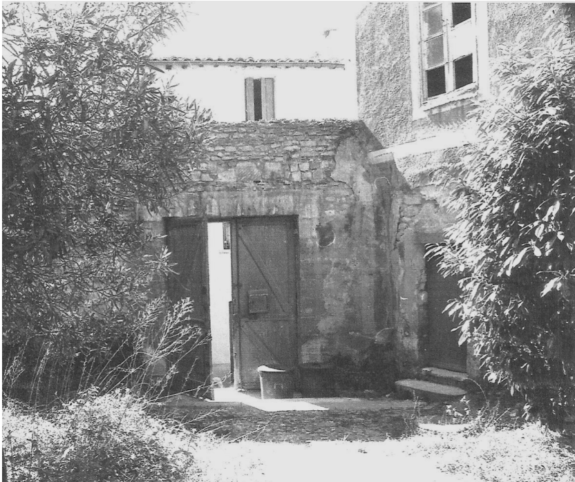
Cour d'entrée du couvent en 1978

Le seul accès au couvent est celui qui existe aujourd'hui du côté de la rue de la Taillade. Un mur élevé le séparait de cette rue et on y accédait par un portail en bois. La cour était pavée de galets, comme actuellement.