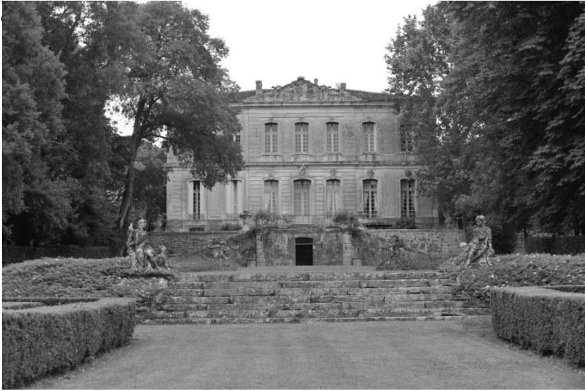
Le château de Bocaud à Jacou

Son fils Philippe le suit dans cette voie au point qu'en 1642, il accueille le Cardinal de Richelieu en son hôtel de la rue Salle-l'Évêque, pour une dizaine de jours.