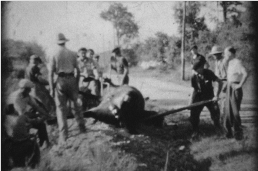
On enterre les chevaux

D'autres vont jusqu'à Lecques où ils décident de stationner. Les derniers, enfin, se rendent au docteur Esprit, du mas de la Clotte [A]. C'est un ancien médecin capitaine qui reçoit de l'officier qui commande le drapeau du régiment 43 . Ils sont conduits à Sommières.