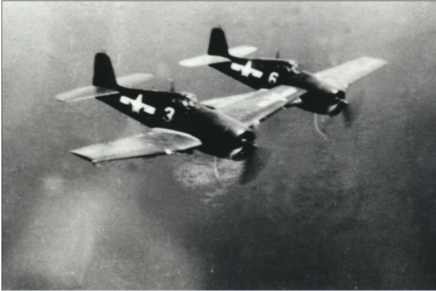
Deux F 6 F-5'S Hellcat's en vol

Au cours de l'attaque les aviateurs tirent 5 000 cartouches et lâchent 5 bombes de 500 livres 47 . Les avions Grumann en transportaient deux sous les ailes. Ils étaient aussi équipés d'une caméra qui se mettait en route dès que le pilote appuyait sur la détente des mitrailleuses. L'avion en comptait six, ce qui permettait, par la suite, de constater les dégâts occasionnés à l'ennemi et d'attribuer les victoires 48 .